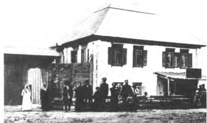
Бай орустун турак жайы. XX к. башы. Чүй өрөөнү.

Россияга каратылгандан кийин Кыргызстандын калкынын саны бир кыйла көбөйгөндүгү байкалат. 1897-ж. Бүткүл Россиялык эл каттоо боюнча Кыргызстандын жаңы администрациялык чегинде 663 миң адам жашаган. Бул 1865-ж. салыштырганда 116 миң адамга көптүк кылган, өсүш 21,2 проценти