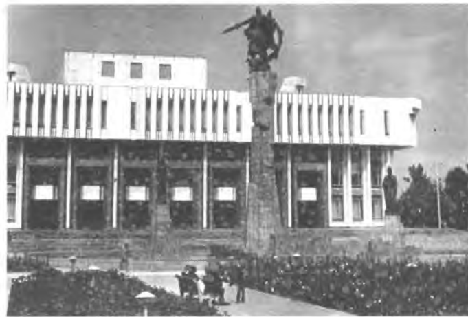
Кыргыз Улуттук филармониясы.

Эгемендүүлүктүн өткөн он жылында Кыргызстанда музей иши бир кыйла жанданды. Республиканын 7 мамлекеттик музейи Эл аралык музейлер кенешине мүчө болушту. Панфилов районунда А. Осмоновдун, Алай районунда Курманжан датканын, Лейлек районунда А. Орозбековдун, Ош шаарында «Улуу Жибек жолу», Нарын шаарында тарыхый-край таануу, Таласта «Манас-Ордо» Аламүдүн районунда «Ата-Бейит» музейлери иштей баштады.