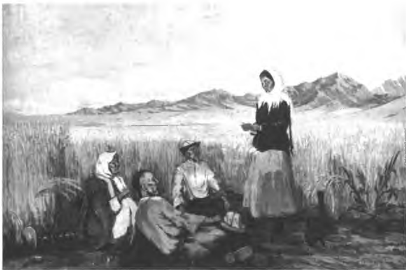
«Фронттон кат». Г. Айтиев.

1951-ж. партия менен Совет өкмөтүнүн башкы жетекчилигинин көрсөтмөсү менен элдердин улуттук эпостору сынга алына баштаган. Кыргыз элинин руханий турмушунун туу чокусу болгон «Манас» эпосуна да «элге каршы багытталган, динчил, эзүүчүлөрдүн кызыкчылыгын көздөгөн, согушту жактаган» чыгарма катары тыюу салынат. Бирок кыргыз интеллигенциясы өздөрүнүн эпосу жөнүндөгү бул чечимге макул болгон эмес. Бас-