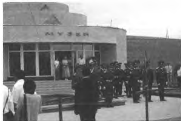
«Ата-Бейит» музейи. Чон-Таш айылы.