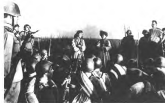
Кыргызстандык артисттер Панфилов дивизиясынын аскерлерине концерт берүүдө. 1943-ж.

Фрунзе областынын Ворошилов районунун Ленин атындагы колхозунун колхозчулары 1941-ж. октябрда коргонуу фондусуна өздөрүнүн менчик бодо малынан бирден семиртип берүү демилгеси менен чыгышкан. Ушул эле райондун «Кызыл Аскер» колхозунун мүчөлөрү колхоздун 50 күлүк атын фронтко берүүнү чечишкен. Бул демилге республикага тез тараган. Тянь-Шань областынын Кочкор районунун колхозчулары 835 жыл-