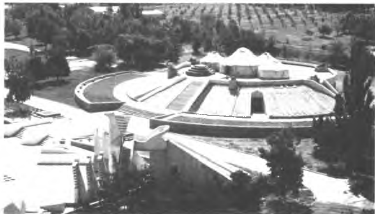
«Манас-айылы» тарыхый-этнографиялык комплекси.

Кыргыздардын этногенезин жана этностук тарыхы тере-нирээк изилдөө үчүн КР УИАнын Тарых институтунун демил-геси менен атайын программа иштелип чыкты. Коомчулуктун өз элинин тарыхына зор кызыгууларын эске алып, програм-манын авторлору кыргыздардын этногенездик жана этностук та-рыхынын проблемаларына чоң көңүл бурушкан. Кыргыздардын тарыхын үйрөнүү жана ага кайрылуу идеологиялык жактан да даярдалган, б. а. коомдун расмий мамлекеттик структуралары жагынан да колдоого алынган. Мунун өзү элдин өз тагдырын аныктап билишинде бир кыйла маанилүү ролду аткалды.