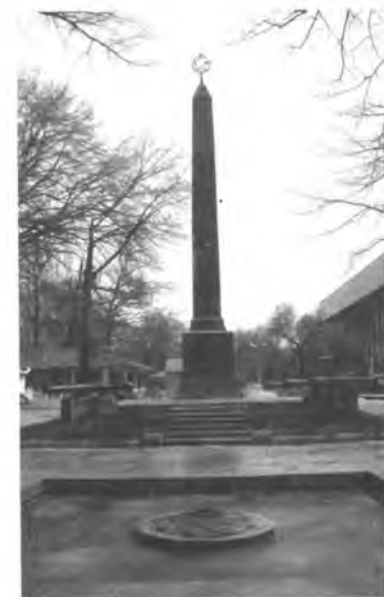
Кызыл гвардияларга коюлган обелиск. Бишкек ш.