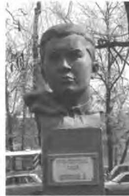
Д. Шопоковдун бюсту. Бишкек ш.

Командованиенин тапшырмасын үлгүлүү аткаргандыгы үчүн 316-аткычтар дивизиясы 8-гвардиялык деген наам алып, Кызыл Жылдыз ордени менен сыйланган. Волоколамск районундагы, Гусинёво деген кыштактын жанында 1941-ж. 18-ноябрда И. В. Панфилов курман болгон. Өлгөндөн кийин ага Советтер Союзунун Баатыры деген наам берилип, ысымы өзүнүн дивизиясына ыйгарылган.