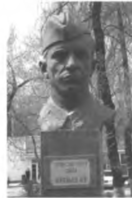
Н. Ананьевдин бюсту. Бишкек ш.