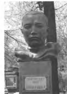
Ч. Түлөбердиевдин бюсту. Бишкек ш.