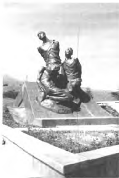
«Ата-Бейит» мемориалдык комплексиндеги эстелик.

Өлкөдө, анын ичинде Кыргызстанда, орногон администрациялык-буйрукчул система, анын массалык жазалоолору социалисттик курулушка өзүнүн оор залакасын, кесепетин тийгизген. Бирок жеке адамга сыйынуучулук, массалык террор совет коомунун маңызын, жалпы элдин куруучулук ишмердигин, СССРдин прогресс жолундагы өнүгүшүн токтоот алган эмес.