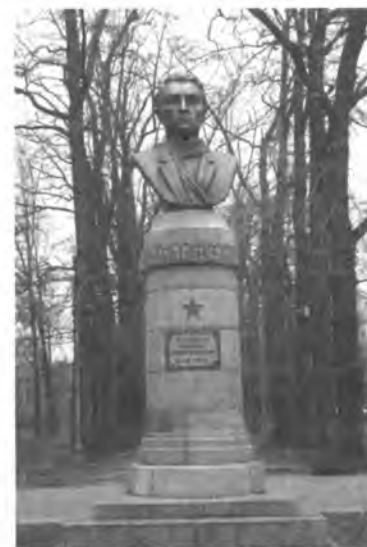
А. И. Иваницындин бюсту. Бишкек ш.

Пишпек уездинде Совет бийлигин орнотуу контрреволюциячыл күчтөрдүн каршылыгына дуушар болуп курч мүнөздө өткөн. 1917-ж. 31-декабрындагы Пишпектин Дубовый паркында 1000ден ашык киши катышкан митинг уезддеги революциялык окуялардын жүрүшүндө бурулуш учур болгон. Митинг большевиктер башында турган бардык революциячыл күчтөрдү чечкиндүү аракетке өтүү үчүн баш коштуруп, Кызыл Гвардия отряддарын түзүү жөнүндө чечим кабыл алган. 1918-ж. 1-январда Пишпектин большевиктери жаны женишке ээ болуп, Пишпек Советинин аскердик жетекчилиги большевиктер менен алмаштырылган. Анын төрагалыгына большевик Г. И. Швец-Базарный шайланган. 1918-ж. 5-январында Пишпек уездинин Советтеринин съезди болуп, бул аймакта Совет бийлиги орногондугун жарыялаган. Февралда Токмок шаарында бийлик Советтердин колуна өтүп, 300 адамдан турган Кызыл Гвардия түзүлгөн. Пишпек уездинде Совет бийлигинин орношу Жети-Суу областынын борбору Верный (азыркы Алматы) шаарында буржуазиянын бийлигин кулатууну бир кыйла жеңилдеткен. 3-мартта Верный да Совет бийлигинин жениши областтын калган аймагында, анын ичинен Пржевальск уездинде Совет бийлигин орнотууда чечүүчү мааниге ээ болгон.