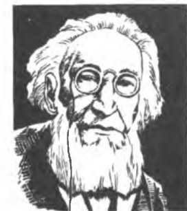
П. П. Семенов-Тянь-Шанский.